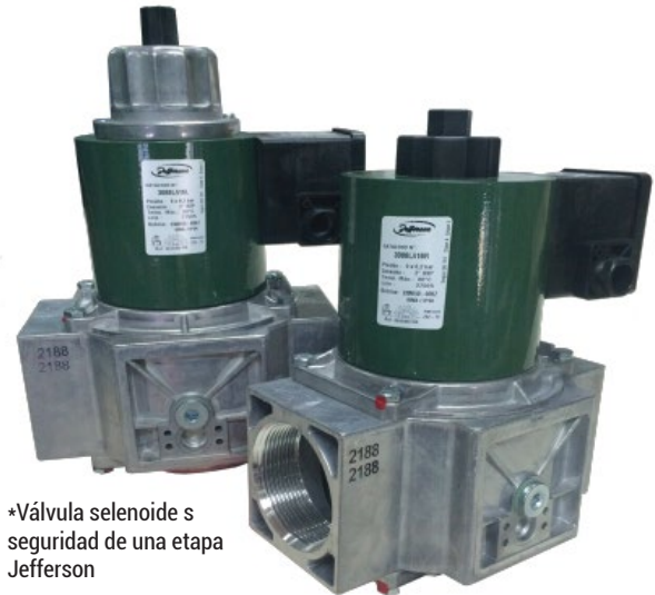
*Válvula solenoide s seguridad de una etapa Jefferson

Válvulas solenoides para usos generales, vapor, combustóleo y refrigeración