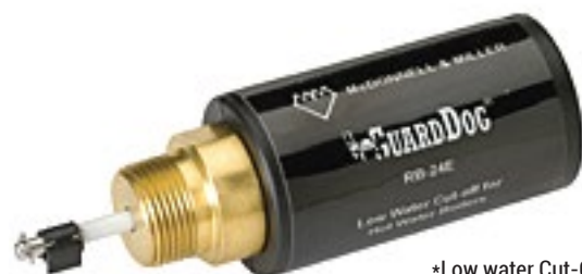
*Low water Cut-Off McDonnell & Miller