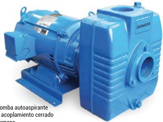
*Bomba autoaspirante de acoplamiento cerrado Barmesa